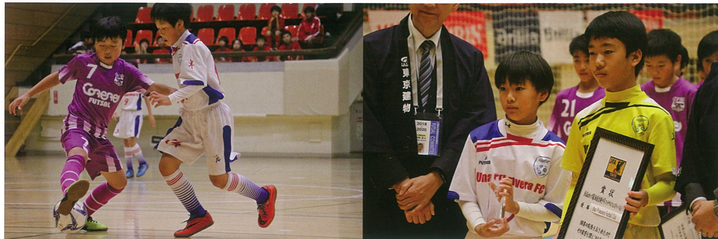
主催：公益財団法人東京都サッカー協会 日時：2019年12月7日(土)～12月14日(土) 会場：世田谷区総合運動場体育館

2019年12月14日、「Brilliaカップ 第3回東京都少年フットサルフェスティバルU-11」が世田谷区総合運動場体育館で開催された。この日の2次ラウンドには1次ラウンドを勝ち上がった16チームが参加。激戦の末に「Una Primavera Football Club」が大会初出場初優勝を果たした。