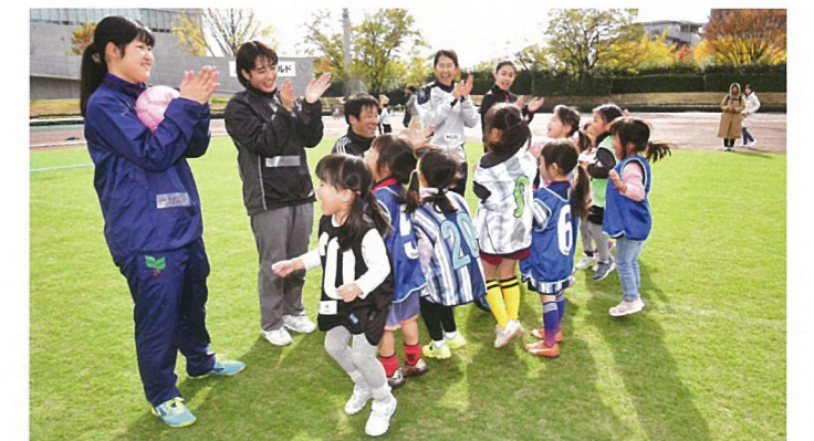
笑顔が咲いた女の子グループ

加えて、今回初めての試みとして組み込まれたのが「女の子グループ」のセッションだ。自信のある女の子は男の子に混ざってプレーすることもできるが、やはり初心者女の子にとっては「サッカーはやりたいけど、男の子たちと一緒にプレーするのはちょっと…」という不安もあるだろう。そういった子供たちにもメインテーマである「サッカーとの良い出会いの場を提供」するべく、女の子のみのセッションを取り入れた。女性コーチの数も多く、優しいお姉さんたちの指導に女の子たちも安心してプレーしているように見え、自然と笑顔の花が咲いた。