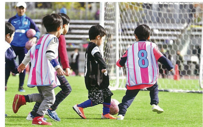
ゲーム系セッションでもボールを必死に追いかける

各セッションでは「おにごっこ系」、「動きづくり系」と、「ボールフィーリング系」ではドリブル、シュートに分かれ4セッションを実施。シュートやドリブルというサッカーと直接関係のあるプレーだけでなく、ボールを使わなかったり、手に持って行うなど、一見サッカーとは関係ないような動きにもサッカーの要素が散りばめられており、サッカーをやったことのある子はもちろん、やったことのないような子供たちも、楽しみながらサッカーに必要な動きを学んでいた。午後の「U-8」の部ではそこにパスなど、よりサッカー的な動きも加えられた。